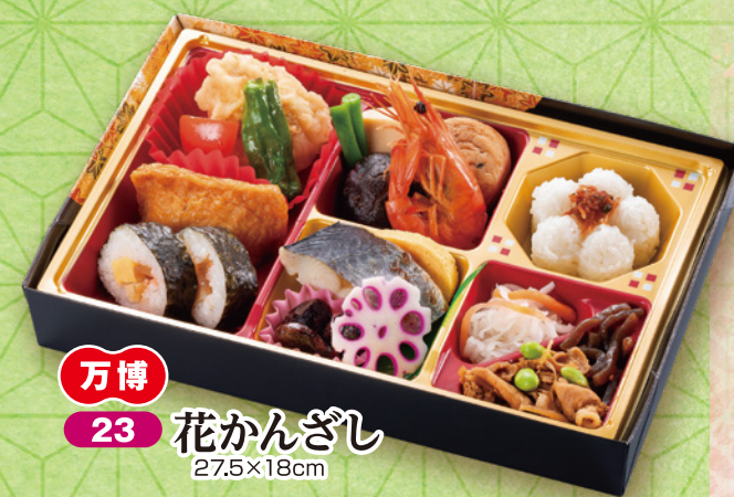
万博 23 花かんざし 27.5×18cm