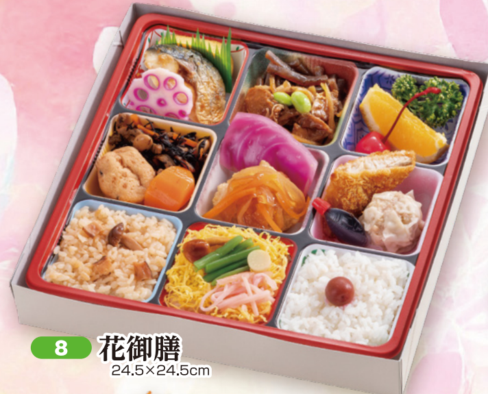
8 花御膳 24.5×24.5cm