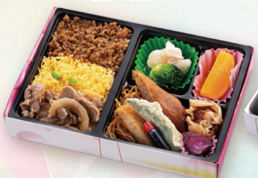
13 肉めし三色弁当 24×16.5cm