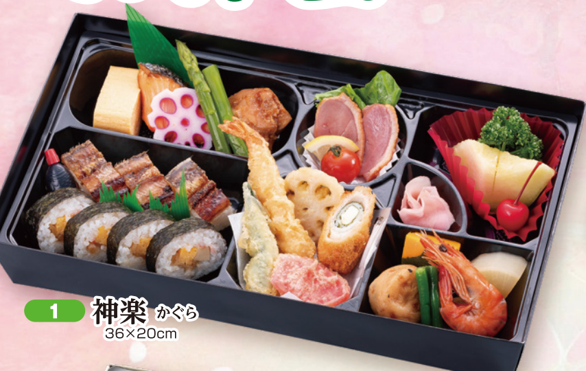
1 神楽 かぐら 36×20cm