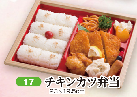
17 チキンカツ弁当 23×19.5cm