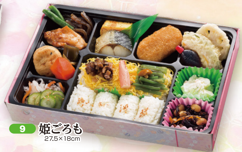
9 姫ごろも 27.5×18cm