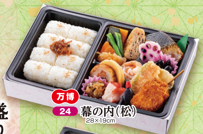
万博 24 幕の内(松) 28×19cm