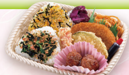
21 おむすび2個弁当 17×13cm