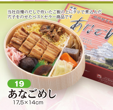
19 あなごめし 17.5×14cm