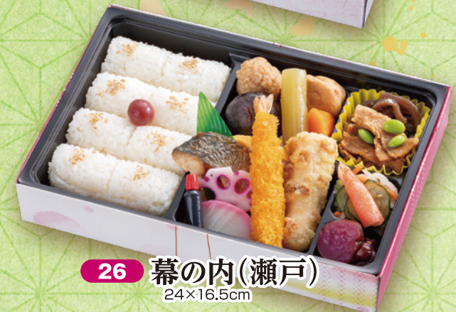
26 幕の内(瀬戸) 24×16.5cm