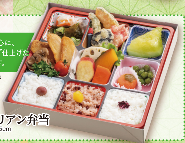
万博 33 ベジタリアン弁当 24.5×24.5cm