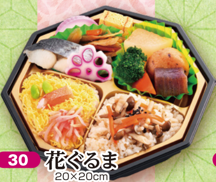
30 花ぐるま 20×20cm