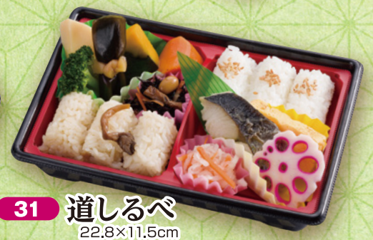
31 道しるべ 22.8×11.5cm