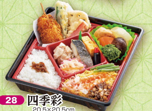
28 四季彩 20.5×20.5cm