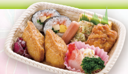
22 助六セット 17×13cm

一緒に いかがですか 紙パック茶(200ml) 110円 (税込) ペットボトル茶(350ml) 150円 (税込) ペットボトル茶(500ml) 170円 (税込)