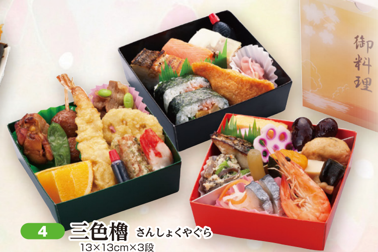
4 三色槽 さんしょくやくら 13×13cm×3段