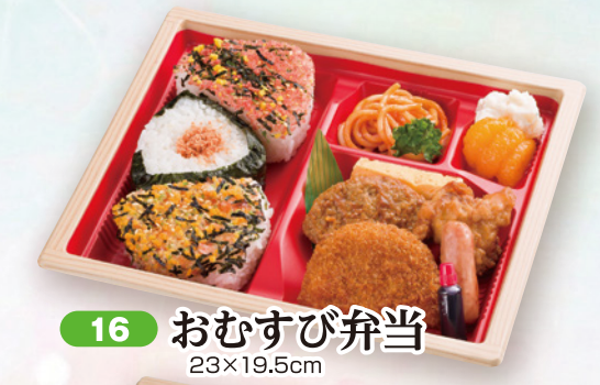
16 おむすび弁当 23×19.5cm

一緒に いかがですか 紙パック茶(200ml) 110円 (税込) ペットボトル茶(350ml) 150円 (税込) ペットボトル茶(500ml) 170円 (税込)