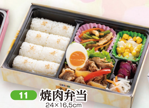
11 焼肉弁当 24×16.5cm