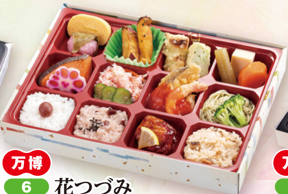
万博 6 花つづみ 29×20cm