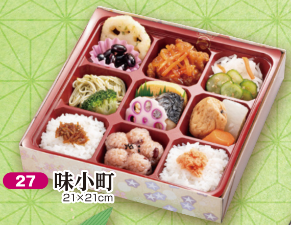
27 味小町 21×21cm