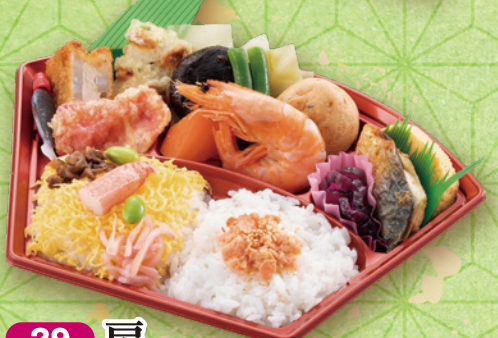
29 扇 24×13cm