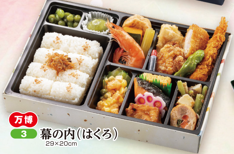
万博 3 幕の内(はくろ) 29×20cm