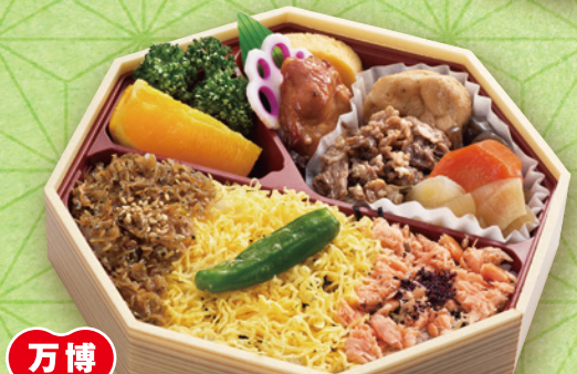
万博 25 銀鮭ほぐし飯と 但馬牛の味くらべ 18.5×18.5cm