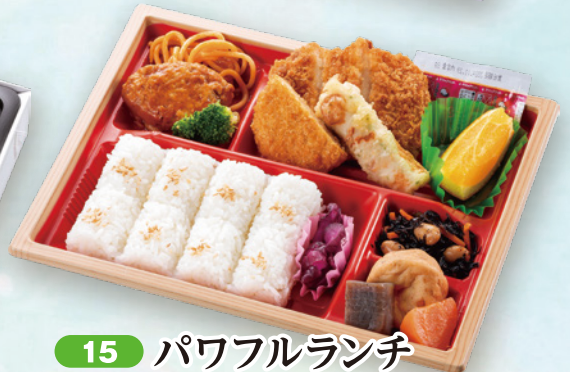
15 パワフルランチ 26.7×20.6cm