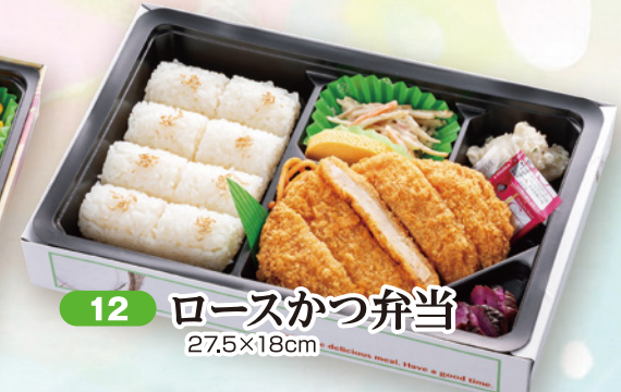
12 ロースかつ弁当 27.5×18cm