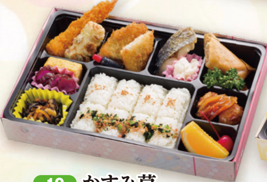
10 かすみ草 27.5×18cm