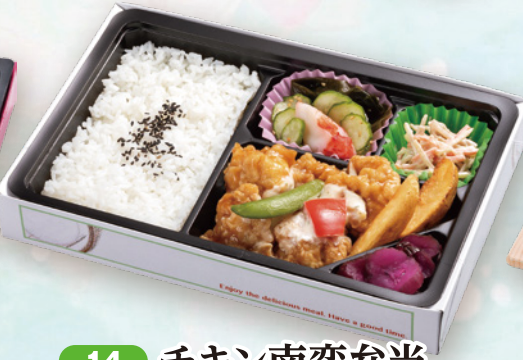
14 チキン南蛮弁当 27.5×18cm