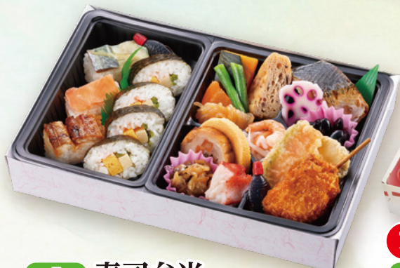
5 寿司弁当 28×19cm