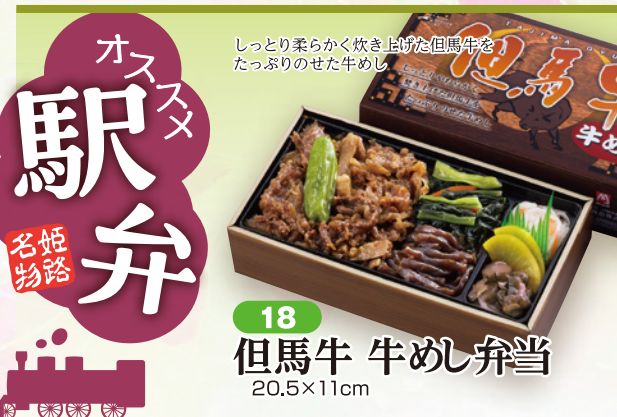
18 但馬牛 牛めし弁当 20.5×11cm