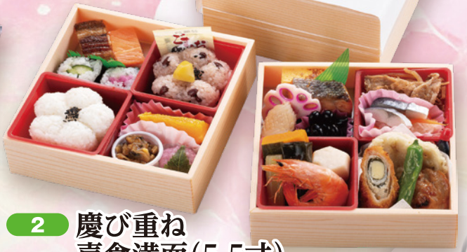
2 慶び重ね 喜食満面 (5.5寸) きしよくまんめん 16.5×16.5cm×2段