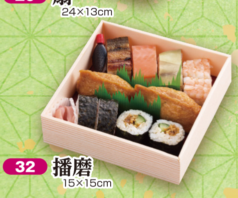
32 播磨 15×15cm