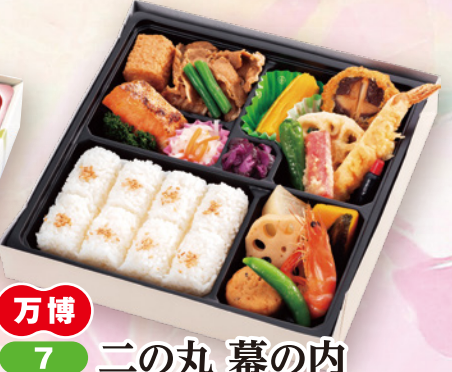
万博 7 二の丸 幕の内 24.5×24.5cm