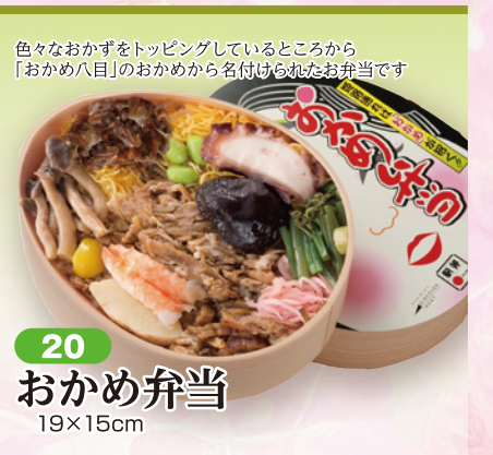
20 おかめ弁当 19×15cm